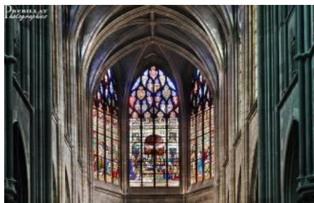
CATHEDRALE DE MOULINS (03)

Vous recevrez début 2015 un reçu fiscal, correspondant au montant total de votre cotisation et de votre don éventuel en 2014.