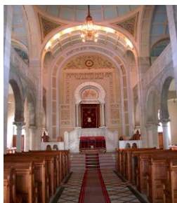
SYNAGOGUE DE THANN (68)