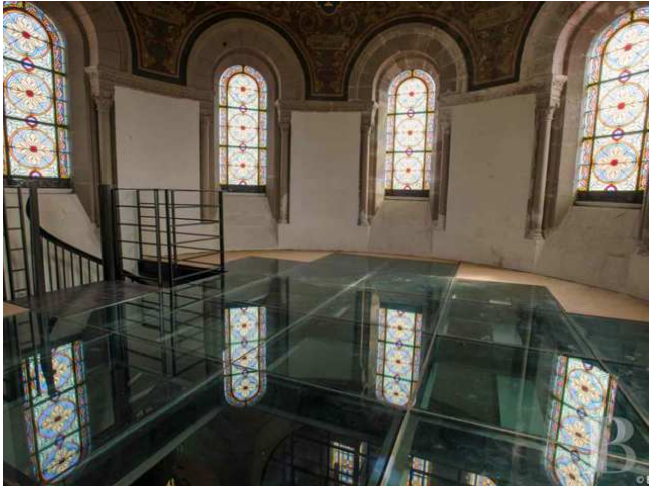
En plein coeur de Nantes, une église de 1860 rehaussée de métal et de verre.