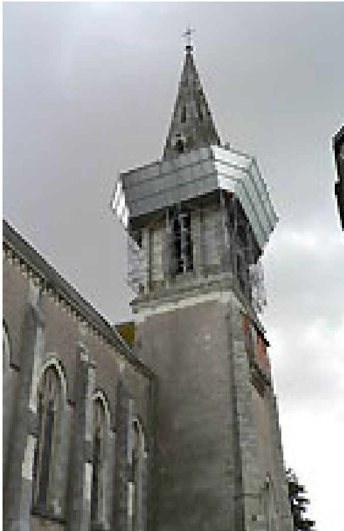
Eglise Saint-Martin de Joué – Valanjou