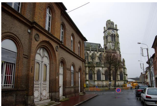
L'église Saint-Jacques d'Abbeville en cours de destruction

Les églises vous concernent : vous avez été nombreux à exprimer vos craintes à travers le sondage en ligne, mais aussi votre envie d'agir pour leur sauvegarde. Nous vous proposons donc de porter un regard sur les acteurs qui, aujourd'hui, œuvrent pour que les clochers continuent de se dresser fièrement dans les villes et les villages de France.